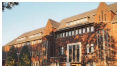
オランダ国立南大学