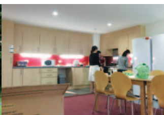
留学先の寮 (サセックス大学)