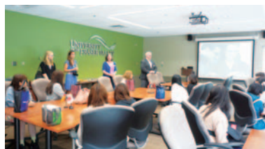
フレーザーバレー大学