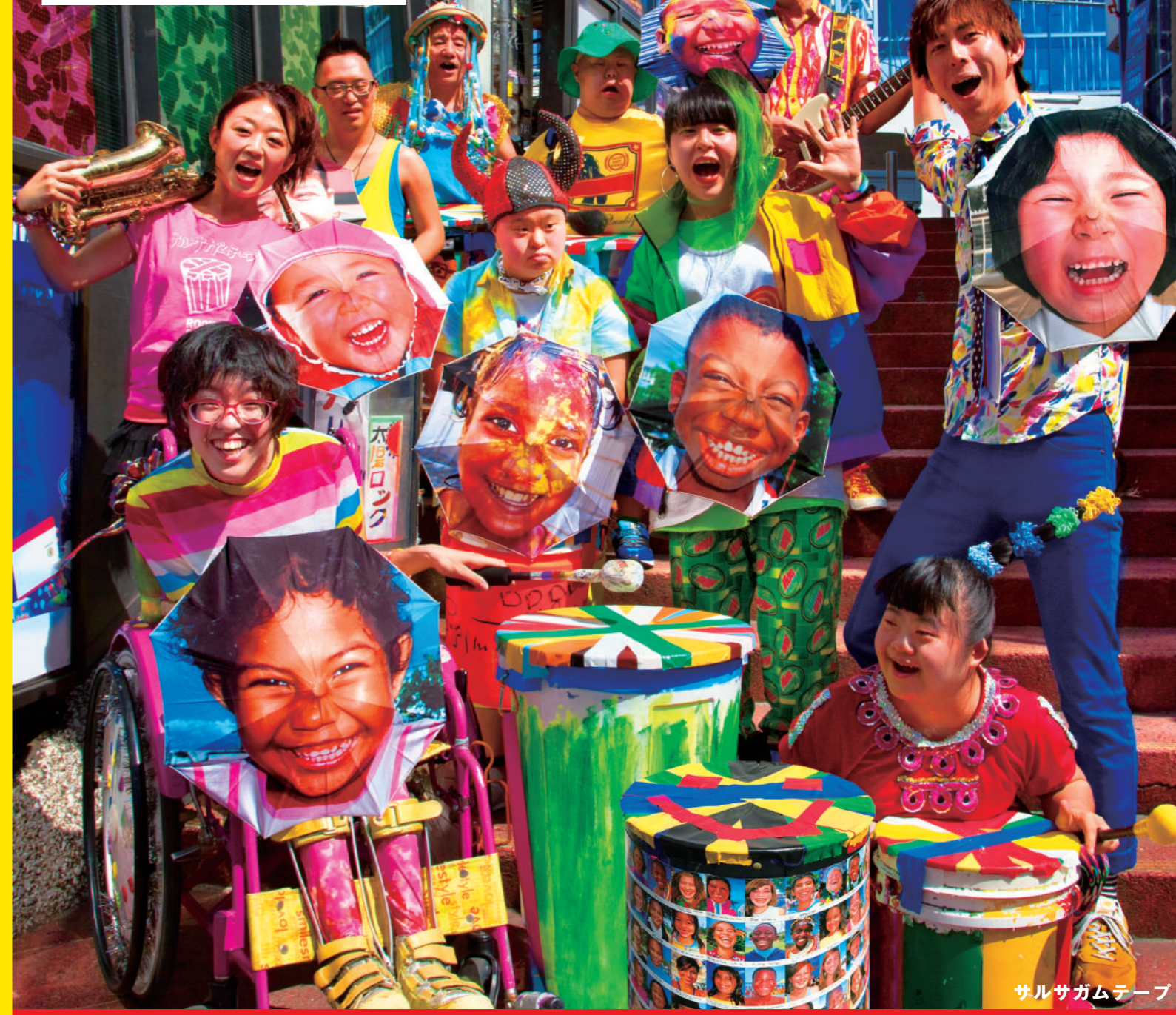
サルサガムテープ