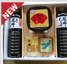
【20-12】 服部醸造 実践オリジナルセット