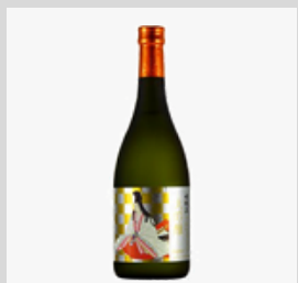
【20-08】 日本酒 女城主大吟醸