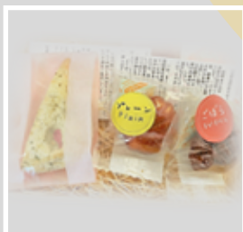
【20-01】 焼き菓子プチギフト