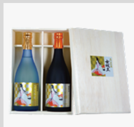
【20-10】 日本酒 女城主純米大吟醸+大吟醸