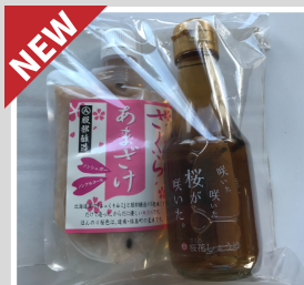
【20-11】 さくら甘酒セット ※桜醤油が欠品の場合、甘酒2本セットになります。