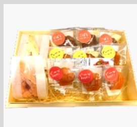
【20-05】 さくらスコーン・ 野菜マドレーヌ