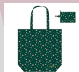
【20-06】 学園オリジナルエコバッグ