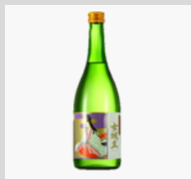
【20-04】 日本酒 女城主特別純米酒