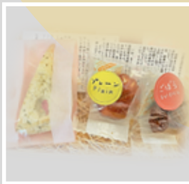
【20-01】 焼き菓子プチギフト