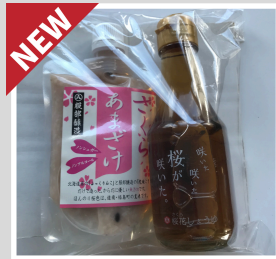
【20-11】 さくら甘酒セット ※桜醤油が欠品の場合、甘酒2本セットになります。