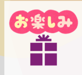
【20-02】 学園オリジナルグッズ