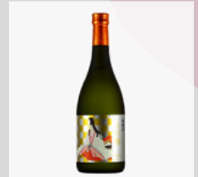
【20-08】 日本酒 女城主大吟醸