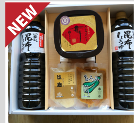
【20-12】 服部醸造 実践オリジナルセット