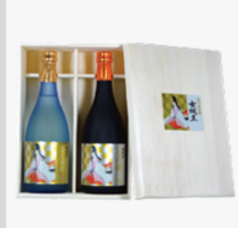
【20-10】 日本酒 女城主純米大吟醸+大吟醸