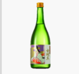
【20-04】 日本酒 女城主特別純米酒