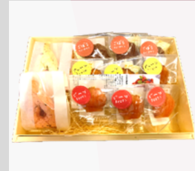
【20-05】 さくらスコーン・ 野菜マドレーヌ