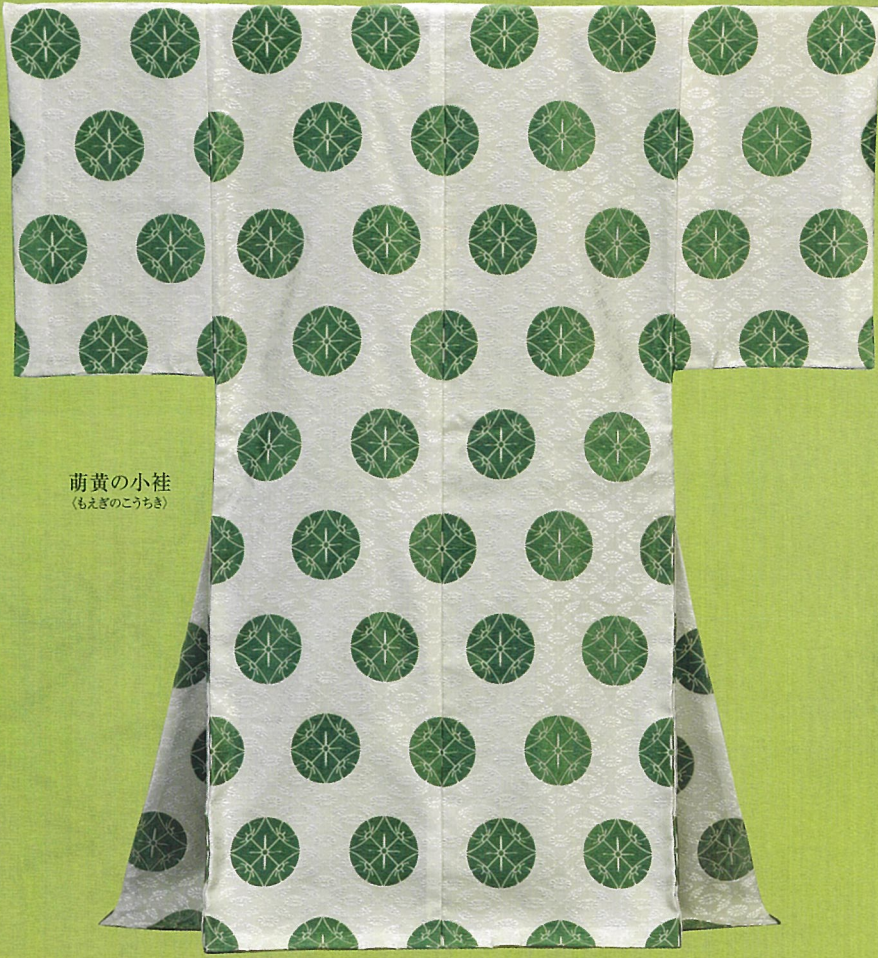
萌黄の小袿 (もえぎのこうちき)

本展では再現装束のほか、完成に至るまでの研究課程を紹介し、本プロジェクトの学問上への寄与、技術の検証、継承の意義深さもご覧いただければ幸いです。約千年前の雅な世界をじっくりと鑑賞、お楽しみ下さい。