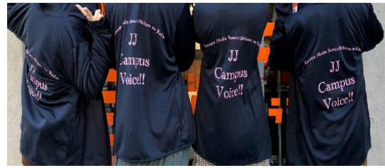
JJ Campus Voice!!の おそろいパーカーをみんなで仲良く着用！