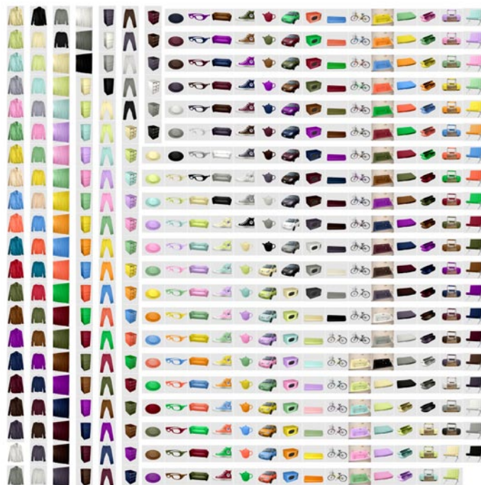
左：研究室の風景、学園祭での制作物と準備風景、評定実験風景など 左上：研究と関わりのある画像（街並みのCG、喫茶店模型、現実に近い画像の撮影条件を探る研究関連、家具模型配置実験、色記憶実験呈示素材） 上：プロダクトのカラーシミュレーション画像（Adobe Photoshop 使用）