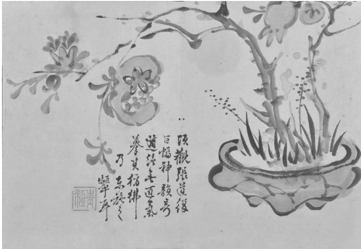
橋本青江「連壁帖」より 実践女子大学香雪記念資料館蔵