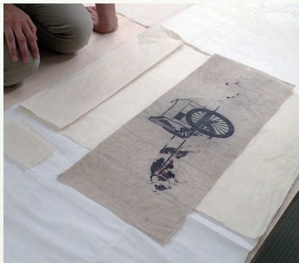
修理会議 肌裏紙の検討

文化・芸術を守り、伝えていくためには、多くの人に作品の歴史的価値、芸術的価値を発信し、関心を持っていただかなければなりません。美術館は作品を知り、知識を吸収する楽しさを体験できる絶好の場所です。展覧会を企画する発想力や、様々な角度から作品の魅力を発見できる眼を養うため、日々精進していかなければなりません。作品と人をつなぐやりがいのある仕事であると感じます。