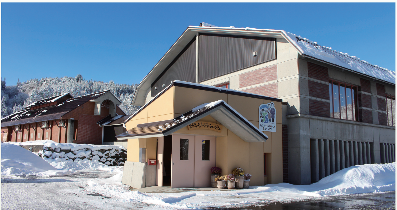
ただみ・モノとくらしのミュージアムの外観。手前が本館で奥が展示棟

〈第1期〉只見町では、1965年から、公民館活動の一環として、民具の収集が行なわれてきました。このころは、高度経済成長期による生活の変化や、ダム建設・水害による集落移転などがありました。不用になり、廃棄されそうになった民具