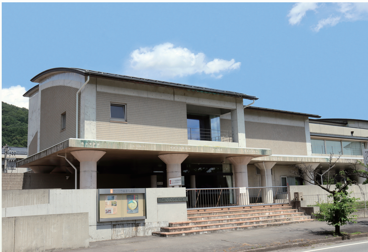
サンリツ服部美術館外観写真

当館では、日本・中国の書画、西洋近現代絵画、陶磁器、漆器、金工など約1400点の作品を収蔵しています。その中には、国宝2件、重要文化財19件、重要美術品19件が含まれています。展示室1（服部一郎記念室）では主に近現代絵画を、展示室2では東洋古美術を中心に展示しており、常に古今東西の美に出会えることが特長といえるでしょう。