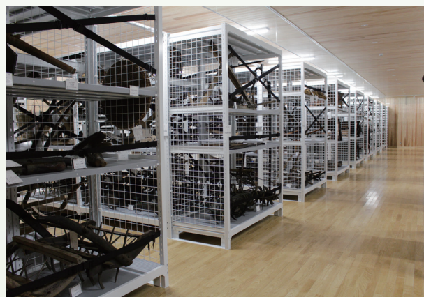
民具収蔵庫の様子

すでに言及したとおり、当館は本館と展示棟を有します。本館には民具収蔵庫と、みんぐふれあいホールと名付けた体験コーナーがあります。収蔵庫は、国指定民具2,333点を収蔵するために作られたもので、職員立ち合いのもと見学することができます。みんぐふれあいホールでは、実際に収集されたトウミヤイトグルマなどの民具に触れることができます。また、仕事着