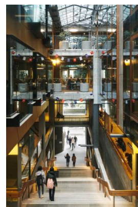
RMIT 大学のメイン校舎を 横断するアーケード