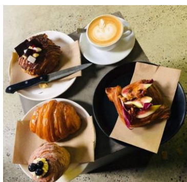
NY タイムズで世界一と称され るクロワッサンのカフェ