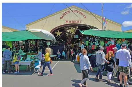
メルボルンでいちばん古い ビクトリアマーケット

RMIT 大学はメルボルン中心地にあるため、授業前後、毎日メルボルン観光が楽しめます！市内中心部を走るフリーのトラムゾーンからも近く、大変便利な立地です。 市内観光と勉強、両方を満喫できる留学です。