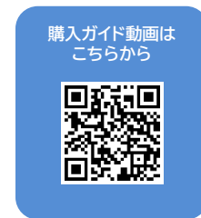
購入ガイド動画は こちらから