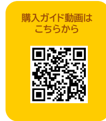
購入ガイド動画は こちらから